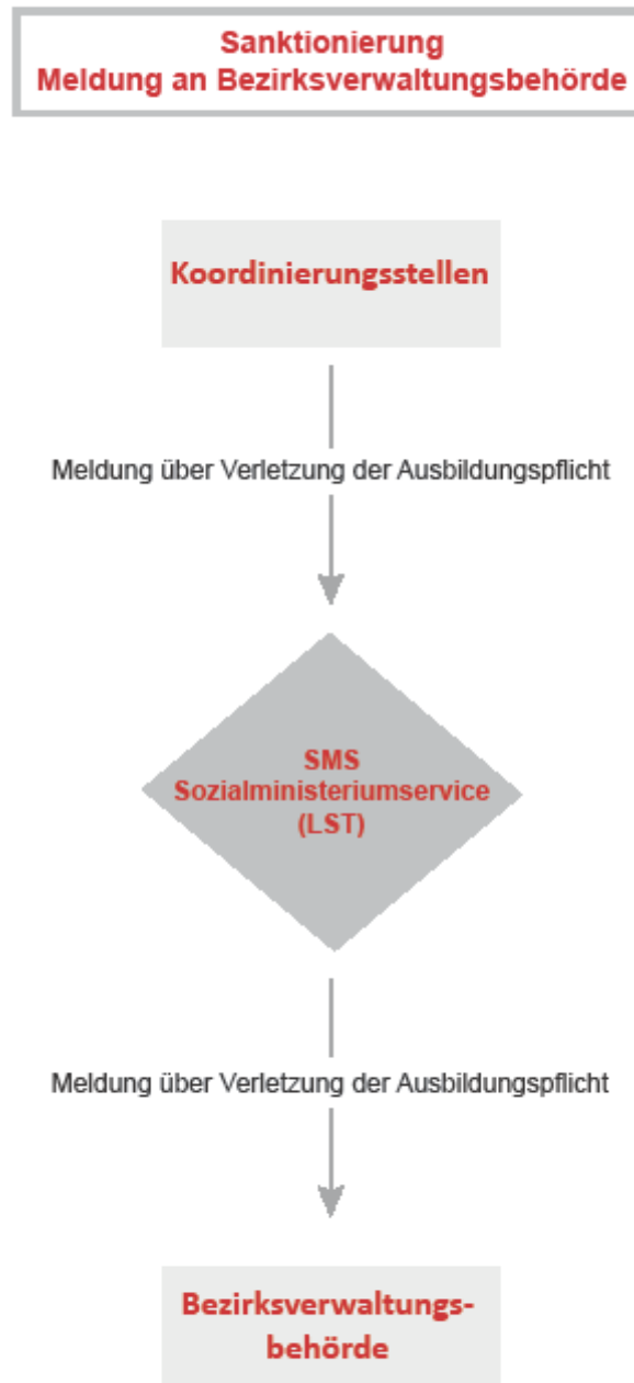
Abbildung 4: Sanktionierung AB18